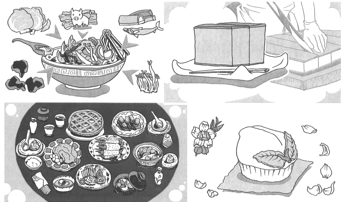
イラスト 川添 紀子

長崎の食文化については、ちゃんぽん・カステラ・皿うどん・ 卓袱料理・普茶料理など、さまざまなキーワードから調べる ことができます。長崎に関する情報を探す際にご活用ください。