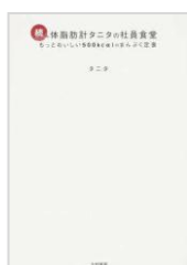
体脂肪計タニタの社員食堂 続 タニタ / 著 大和書房 K596 タ

商品の新たな使い方を提案することは、企業の定番ブランドの活性化にもつながります。消費者にとっても、その道一筋である企業の“お墨付きレシピ”は興味深いものかもしれません。レシピ本を選ぶ基準は、どんな料理を作りたいのか、その目的によって様々ですが、身近な商品ひとつでいつもと違う味わいを気軽に試すことができる企業レシピ本が、レシピ界の新定番となり得るかどうかが、今後の動向に注目です。