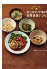
世界をつなぐあこがれ企業の社員食堂レシピ TABLE FOR TWO / 編著 東洋経済新報社 K596 セ