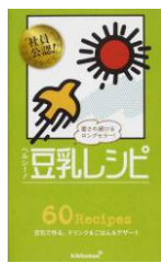
ヘルシー！豆乳レシピ キッコーマン飲料株式会社 / 監修 ワニブックス K596.3 ヘ