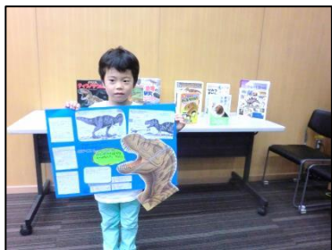
参加者アンケートより

しら 調べてまとめる たいけん 体験が はじめてで たいへん だったけど おもしろかった