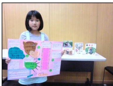
参加者アンケートより